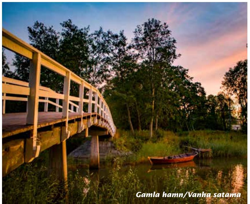
Gamla hamn/Vanha satama